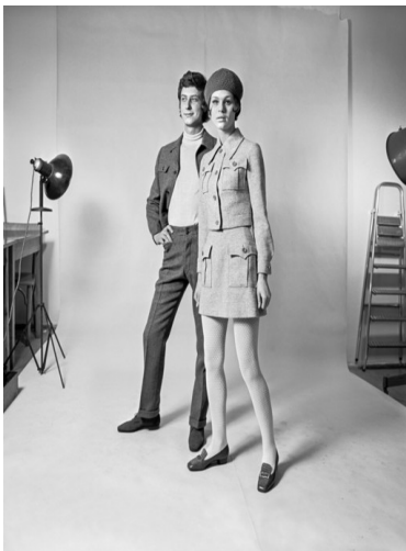
Abb. 10: Tschechoslowakische Mode der 1960er Jahre https://www.sng.sk/sk/vystavy/1046_nech-sije-moda-na-slovensku-1945-1989 (23.8.2018)