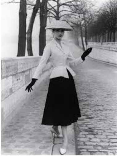
Abb. 1: Christian Diors New Look , 1950er Jahre https://www.dior.com/couture/en_int/the-house-of-dior/the-story-of-dior/the-new-look-revolution (23.8.2018)