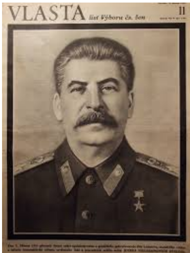
Abb. 6: Stalin. Vlasta, Jg. VII, Nr. 11, März 1953

http://www.dazeddigital.com/fashion/article/34648/1/how-saint-laurent-got-naomi-campbell-her-first-french-vogue-cover (23.8.2018)