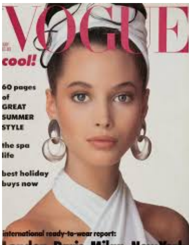
Abb. 4: Christy Turlington. Vogue UK, Juli 1986 http://www.doubledenimdays.com/blog/2017/5/3/fashion-fix-classic-vogue-covers-of-the-80s (23.8.2018)