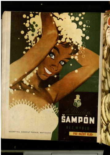
Abb. 9: Shampoo-Werbung des Staatsbetriebes «Kozmetika» Život, Jg. VIII, 1958