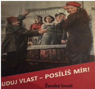
Abb. 7: «Bau die Heimat auf – stärke den Frieden». Vlasta, Jg. V, Nr. 4, 25. Januar 1951