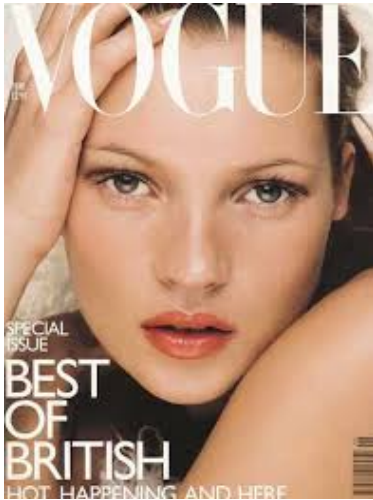
Abb. 3: Kate Moss. Vogue UK, Juni 1998 https://www.vogue.co.uk/gallery/kate-moss-on-the-cover-of-vogue