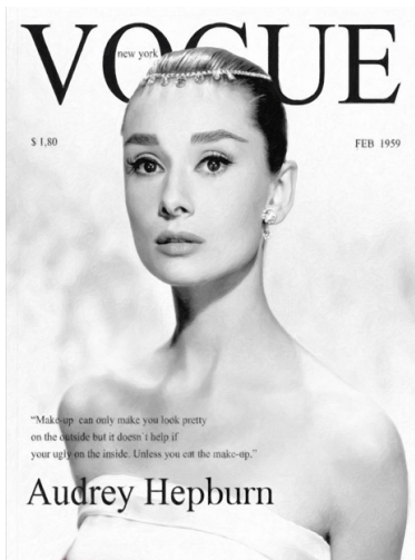
Abb. 2: Audrey Hepburn. Vogue USA, Februar 1959 https://www.pinterest.at/pin/463730092864106568 (23.8.2018)