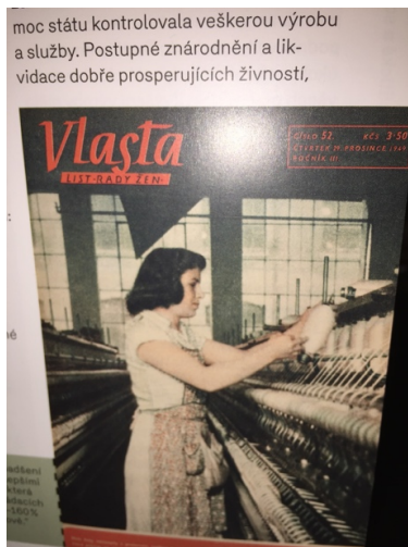
Abb. 8 Fabrikarbeiterin. Vlasta, Jg. III, Nr. 52, 1949